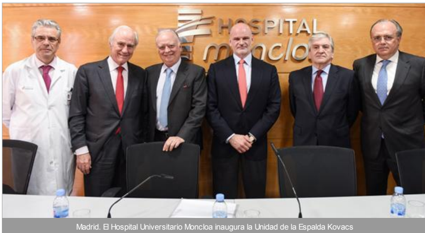
Madrid. El Hospital Universitario Moncloa inaugura la Unidad de la Espalda Kovacs