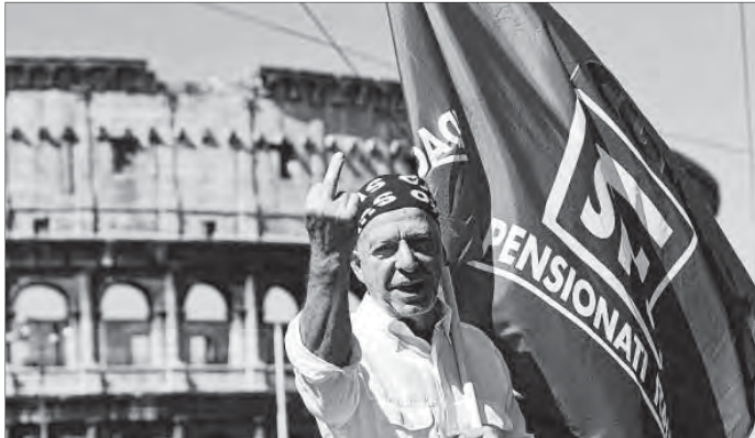
Un manifestante, ayer, durante la huelga general en Italia.